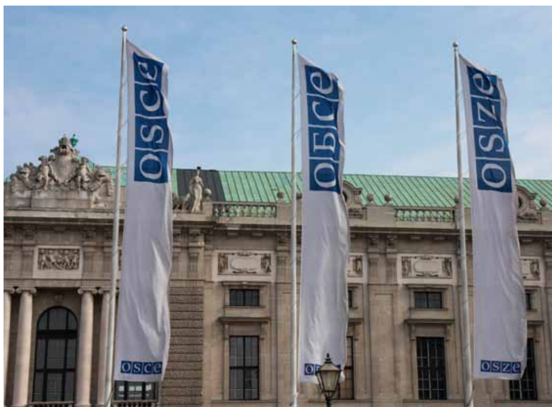
Hofburg, sídlo OBSE ve Vídni, zdroj: OBSE.

Během prvního přípravného zasedání 19. EEF na za-