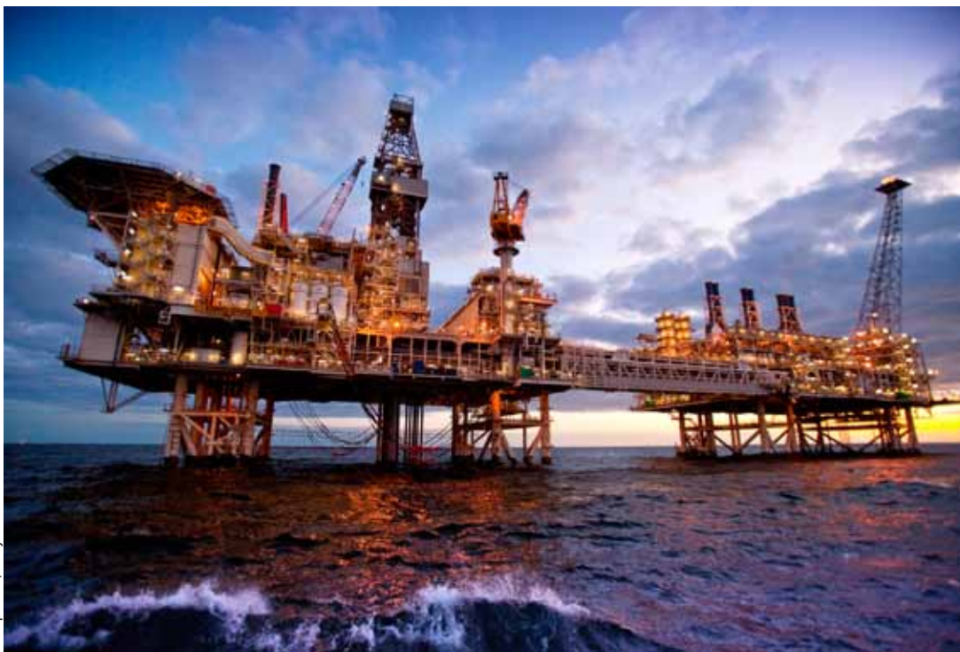
Vrtná plošina

sovětské ropné produkce. 8 V současnosti v oblasti samotného Baku téměř žádná ropa nezbyvá, slibná naleziště však byla v posledních desetiletích existence Sovětského svazu objevena ve vzdálenosti několika desítek námořních mil od Apšeronu. Právě kvůli masivní těžbě sibiřských uhlovodíků a technologické a finanční náročnosti těžby z offshore ložisek ovšem nebyla využívána. 9