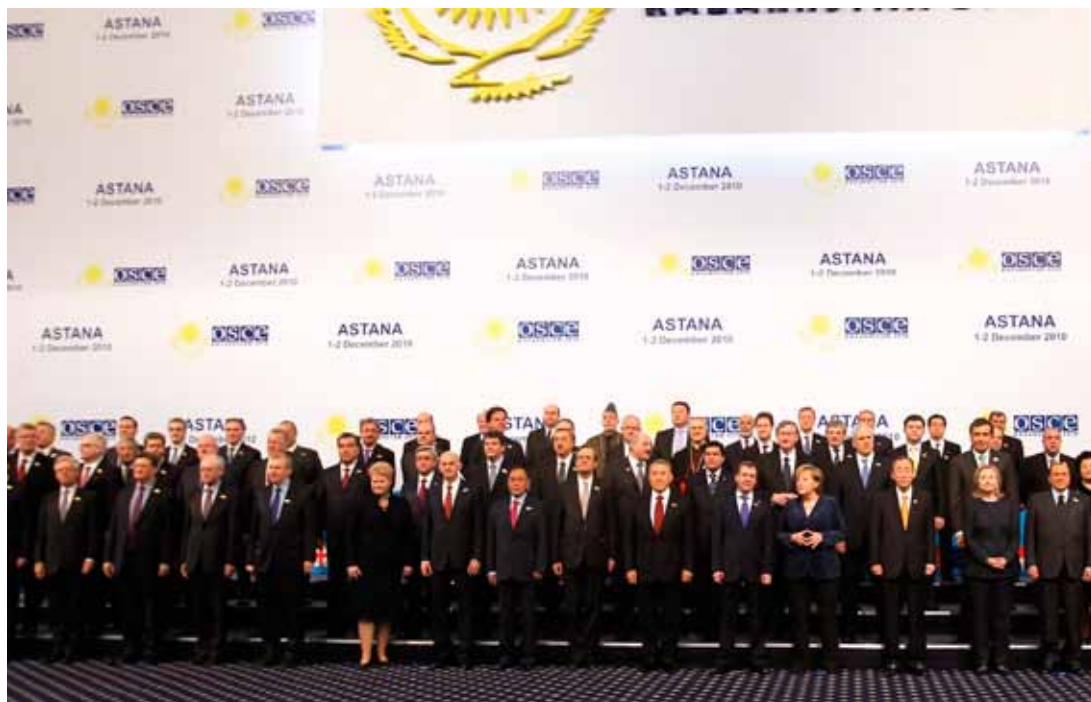
Summit OBSE v Astaně

V současné době OBSE řídí 17 misí či úřadů v zemích jihovýchodní Evropy, východní Evropy, Kavkazu a Střední Asie. Nejnákladnější položkou v rozpočtu OBSE je mise v Kosovu, která má k dispozici asi 16 % rozpočtu celé organizace (tj. asi 27 mil. EUR). Nejvíce finančních prostředků využívá OBSE v regionu jihovýchodní Evropy (asi 42 % celkového rozpočtu).