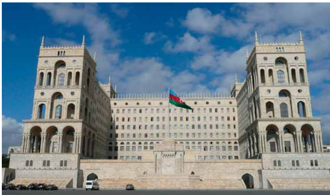
Baku, zdroj: JemSakar

Pokyny pro autory a informace o předplatném jsou k dispozici na www.iips.cz .