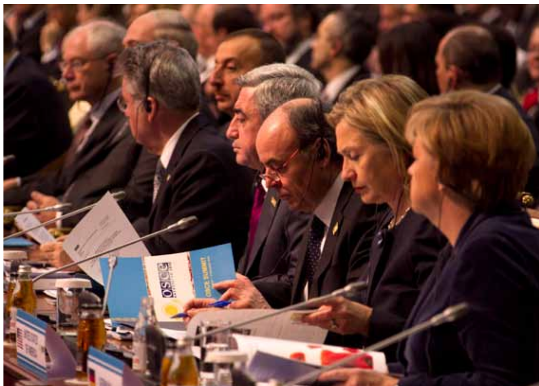
Summit OBSE v Aстане

Kazašské predsedníctvo prinieslo „rozporuplné výsledky.“ Oficiálne vyhlásenie predstaviteľov Kazachstanu boli plné slov o úspechu a dosiahnutí stanovených cieľov. Jedným z takýchto vyhlásení bolo aj hodnotenie zo strany prezidenta Nazarbayeva: „ Odchádzajúci rok