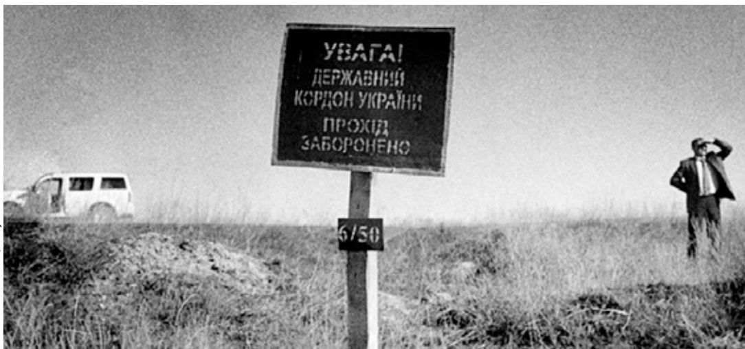
Mise OBSE v Podněstří, zdroj: OBSE.

IIPS se aktivně podílí na for- mování současné podoby politické vědy tím, že ini- ciuje a realizuje vlastní vý- zkumné projekty, pravidelně zveřejňuje výsledky svého výzkumu v periodických i neperiodických publika- cích, koordinuje a organizu- je konání odborných konfe- rencí, seminářů a přednášek.