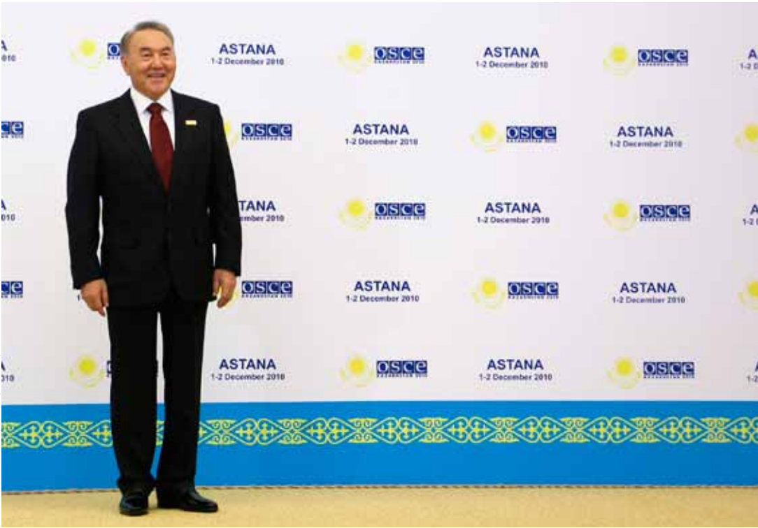
Prezident Nursultan Nazarbayev, zdroj: OBSE.

Více informací získáte na adrese časopisu www.globalpolitics.cz .